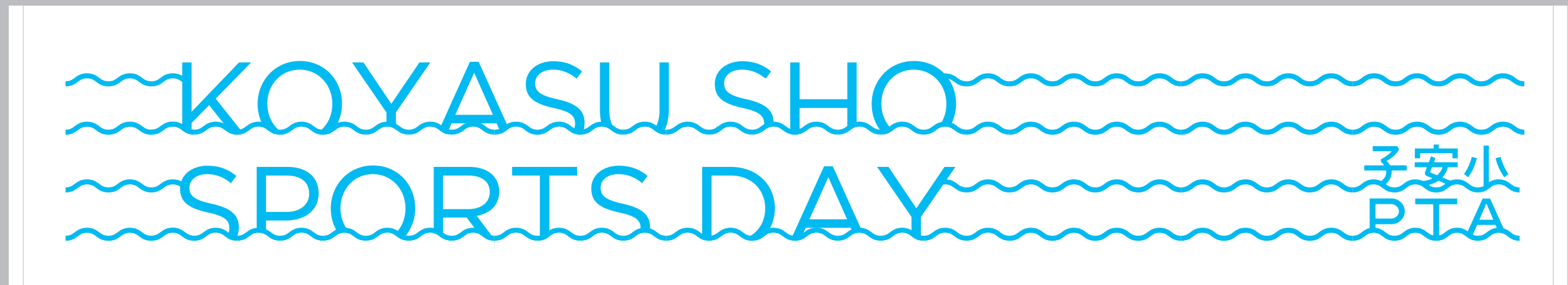
スポーツタオル | W1000 x H200 (30%)