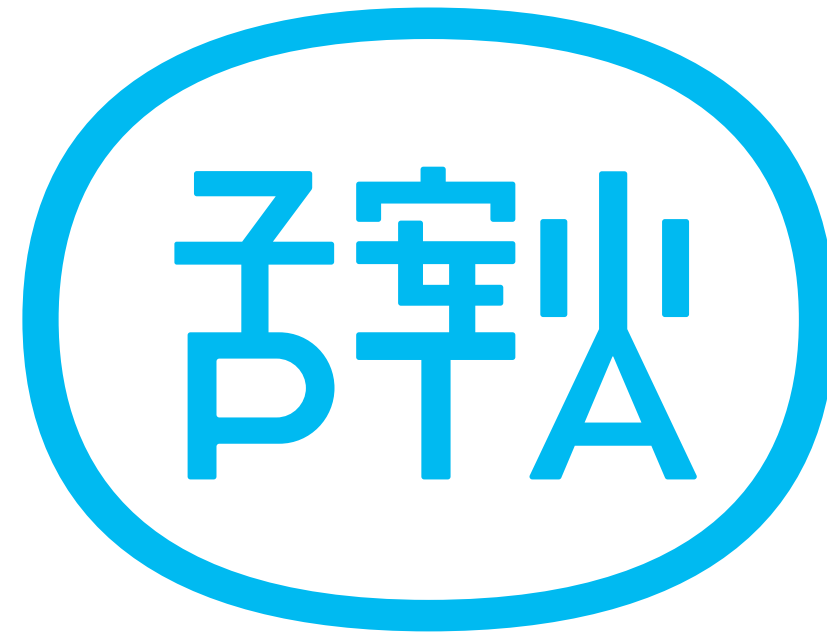
横浜市立子安小学校 PTA