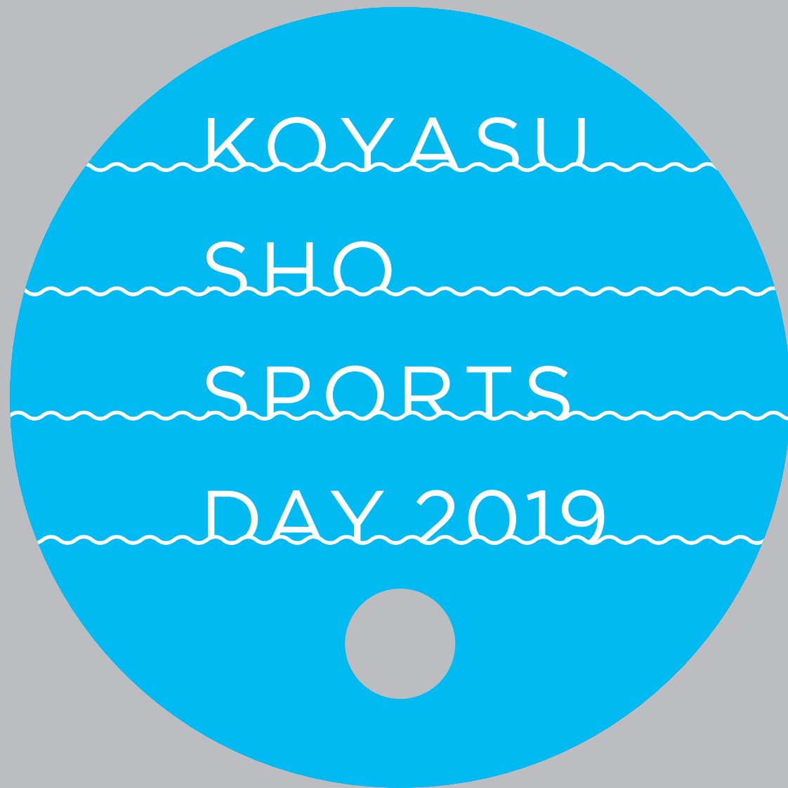
団扇 | φ210 (70%)