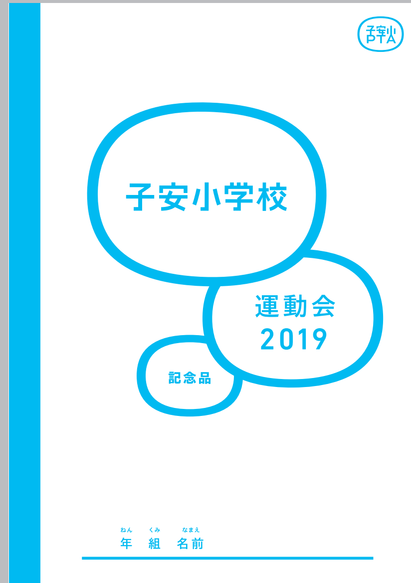
ノート | B5 (60%)