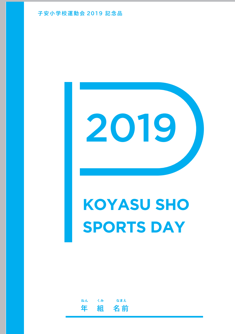
ノート | B5 (60%)