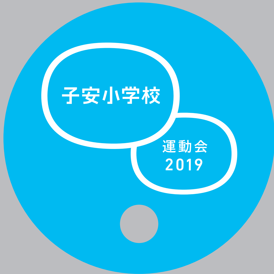
団扇 | φ210 (70%)