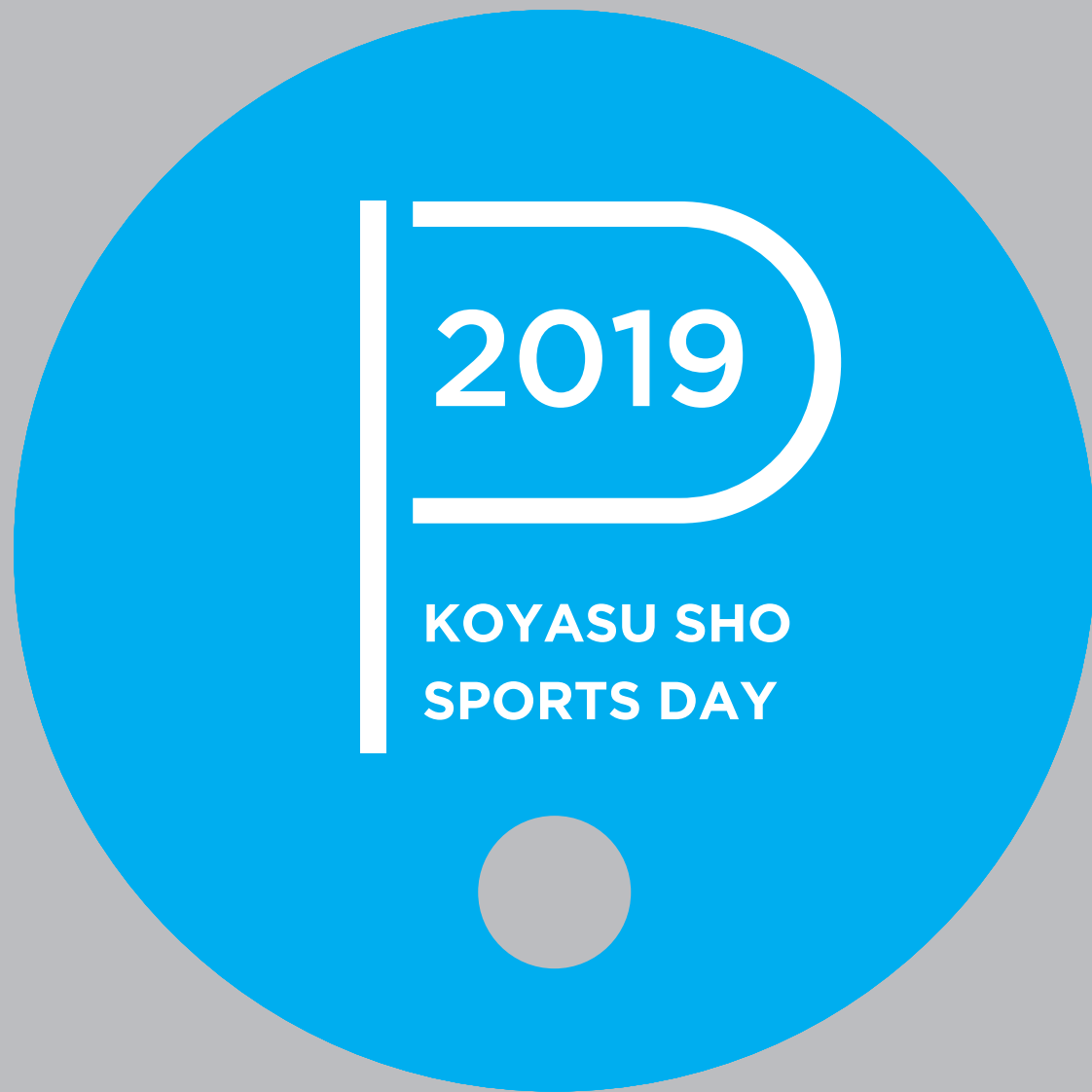
団扇 | φ210 (70%)