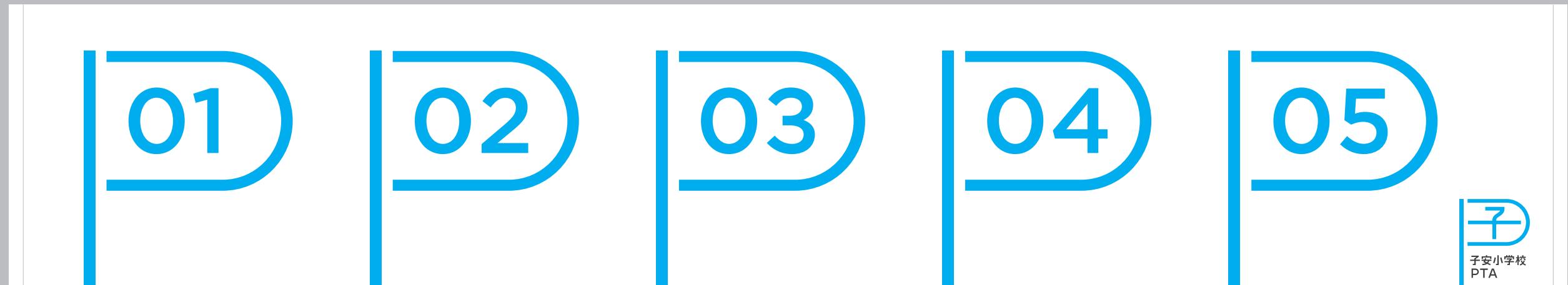
スポーツタオル | W1000 x H200 (30%)