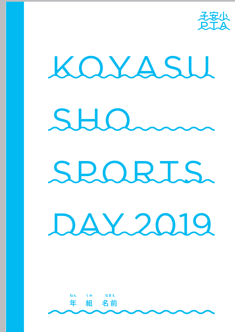
ノート | B5 (60%)